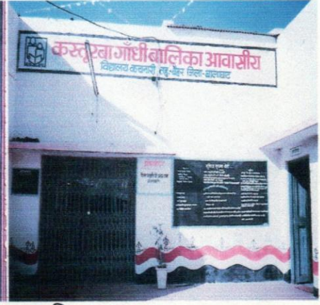
विद्यालय का मुख्य द्वार