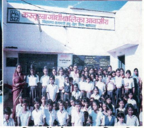
सहायिकाओं के साथ बालिकाएँ