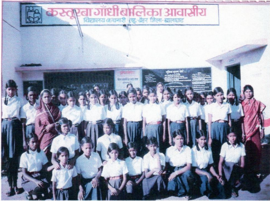
कस्तूरबा गांधी बालिका विद्यालय में अध्ययनरत बालिकाएँ